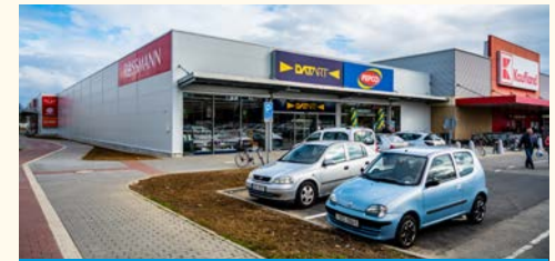
Nest Uherské Hradiště (CR) – opened in March 2019 Developer: RC Europe