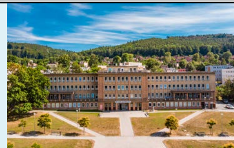
Poliklinika Zlín (CR) ■ Owner: RC Europe

the reconstruction of a medical clinic vestibule at the end of this year. This will also make room for modern spaces for the Benu pharmacy.