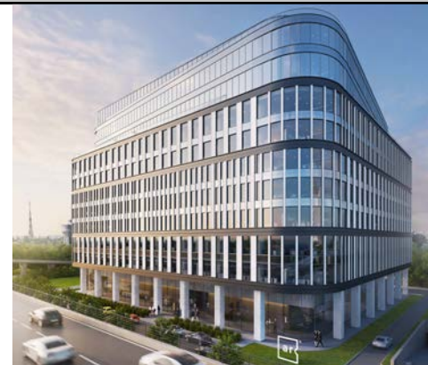
Kancelářský projekt ARC v Bukurešti (30 000 m 2 ) Developer: RC Europe

pobočka RC Europe. „ Kancelářský sektor je dnes v portfoliu firmy zastoupen nejsilněji: Tvoří 55 % celkového objemu , zatímco retail parky představují 25 % , rezidenční projekty 10 % a zbyvajících 10 % tvoří zdravotnická zařízení,“ upřesnil Jan Prokop.