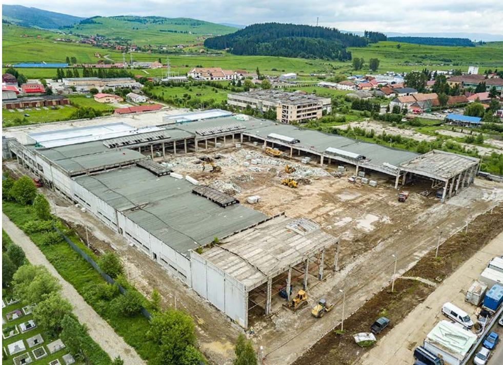
Retail park Nest Miercurea Ciuc (12 000 m 2 ), Rumunsko – ve výstavbě ■ Developer: RC Europe