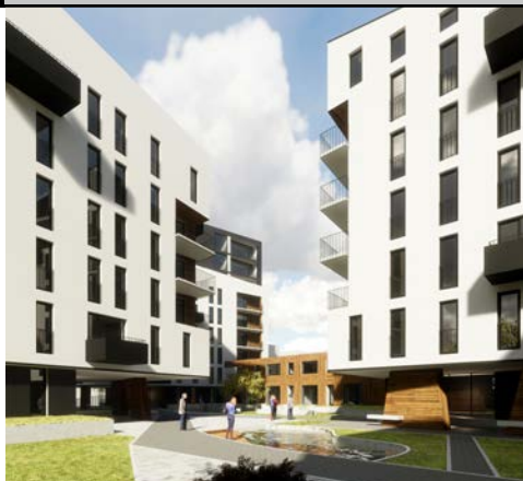
Cube Brno – redevelopment někdejšího areálu Penam v centru města ■ Developer: RC Europe