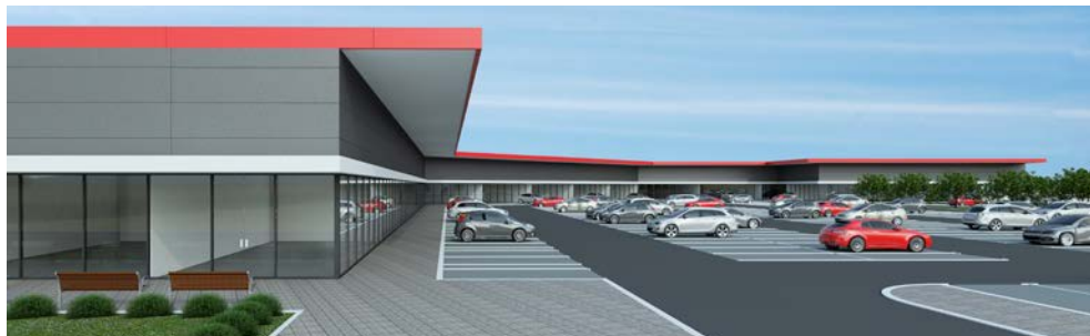
RC Europe slaví letos 5. výročí na srbském trhu. V letech 2019/2020 zahájí na tamním trhu tři nové stavby Nest Kraljevo II, Nest Vršac a Nest Obrenovac (na vizualizaci). Na podzim otevře Nest v srbské Užici