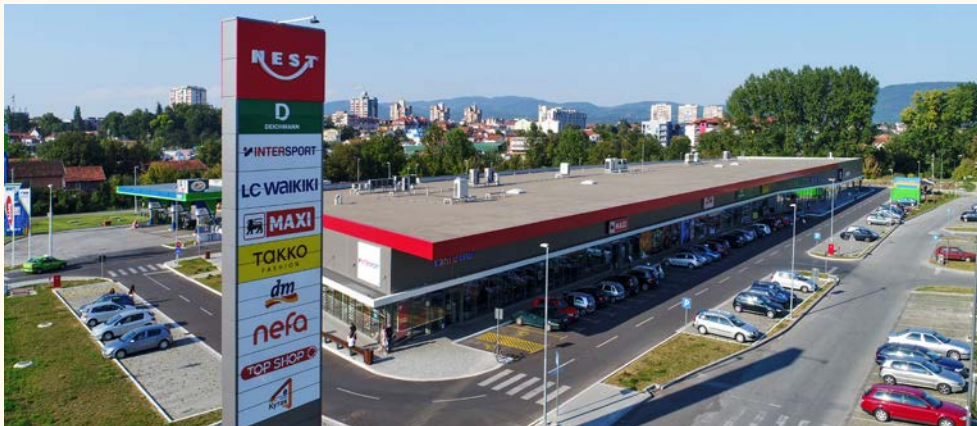
RC Europe is expanding in Serbia and Romania Photo: Retail park Nest Kraljevo I (Serbia). The second phase to start construction this year